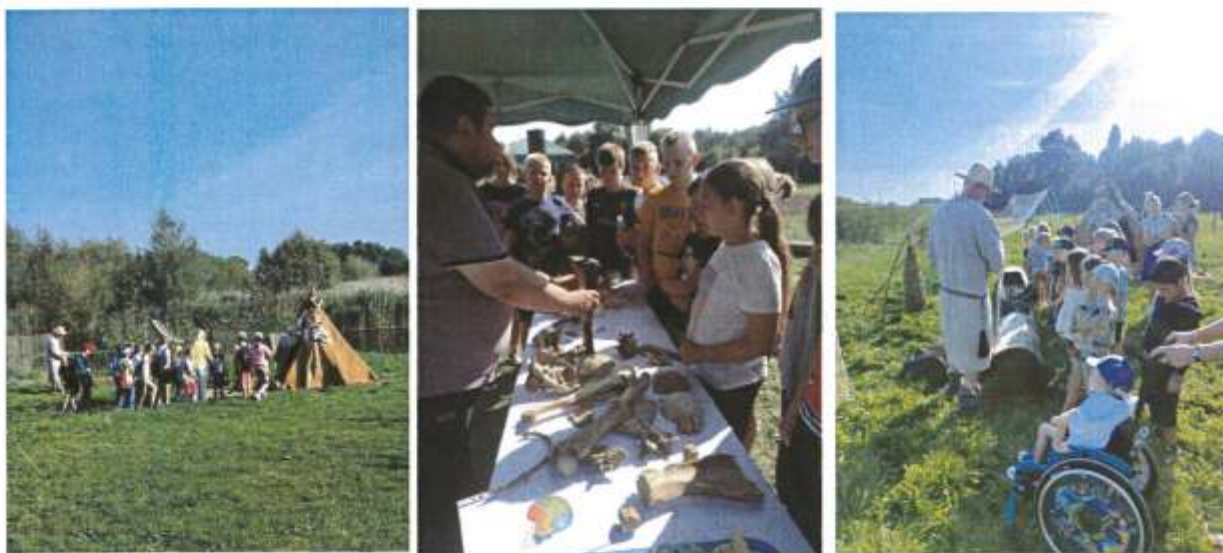
Zdjęcie 16. Uczniowie Szkoły Podstawowej nr 1 w Brześciu Kujawskim podczas pikniku historycznego nad jeziorem Cmentowo 8.09.2023r.