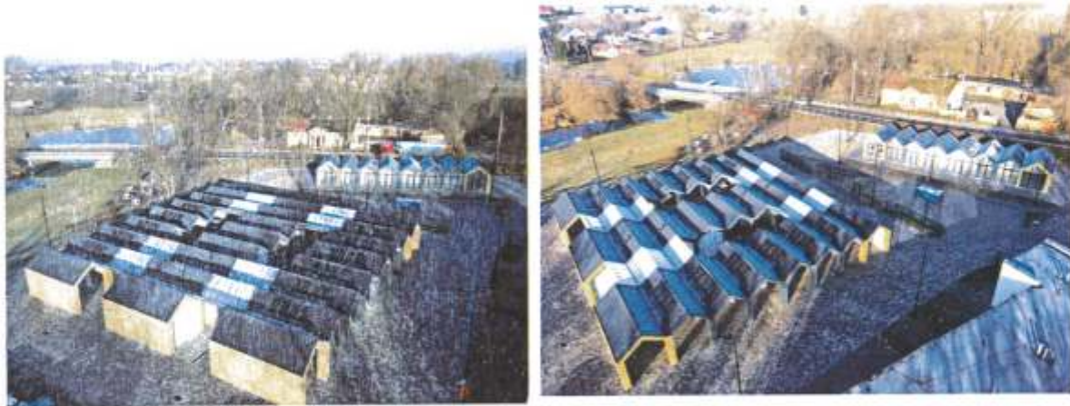
Zdjęcie 5. Targowisko miejskie po zakończeniu prac przez wykonawcę (grudzień 2023 r.)

- część 2. Rewitalizacja zabytkowego centrum Brześcia Kujawskiego. Przedmiotem inwestycji jest min. zagospodarowanie Placu Władysława Łokietka w Brześciu Kujawskim, w tym przebudowa i remont placu głównego, miejsc postojowych, budowa fontanny, obiektów małej architektury wraz z niezbędnymi urządzeniami budowlanymi i infrastrukturą techniczną. Wartość zadania inwestycyjnego wynosi 6 498 307 zł, w tym otrzymano dofinansowanie z programu Polski Ład na kwotę 4 500 000 zł. Zadanie inwestycyjne jest w trakcie realizacji.