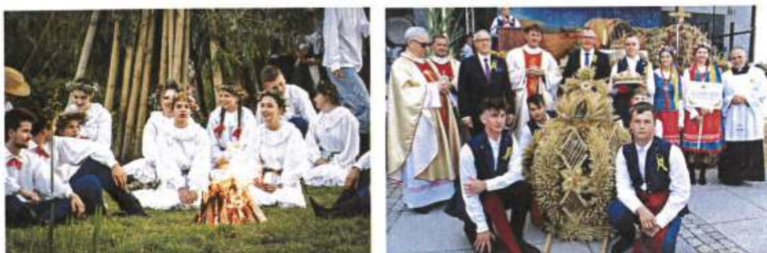
Zdjęcie 12. od lewej: Obchody Nocy Świętojańskiej nad rzeką Zgłowiączką (2023 r.) od prawej: Dożynki Gminno-Parafialne (2023 r.)

d) organizacja imprez lokalnego zasięgu, przybliżających mieszkańcom gminy i regionu wartości historyczne gminy: