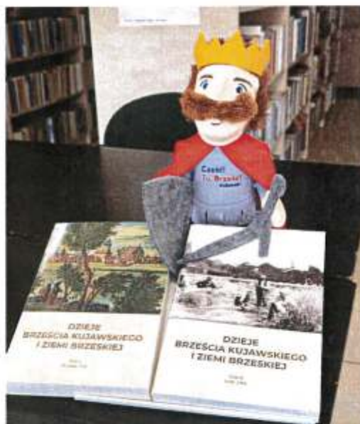
Zdjęcie 20. Monografia Brześcia Kujawskiego tom I i II