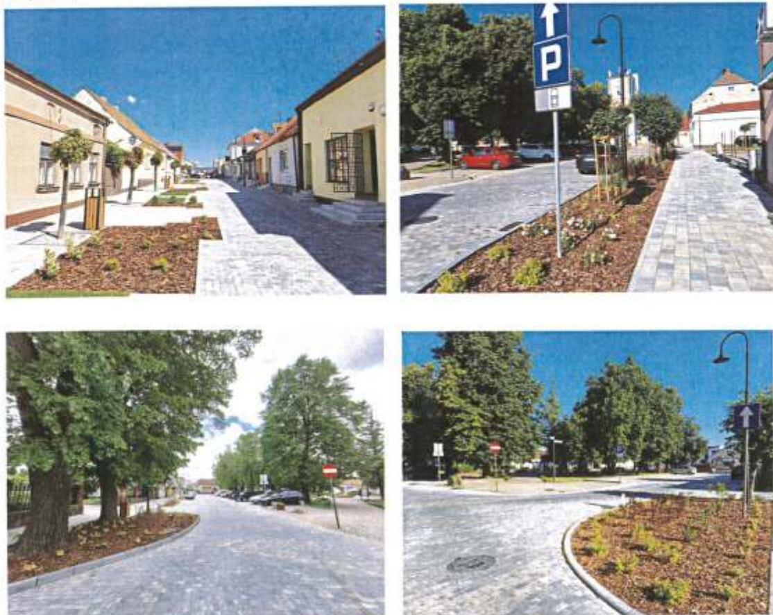
Zdjęcie 6. Centrum Brześcia Kujawskiego po przebudowie układu komunikacyjnego wraz z nowymi nasadzeniami (2023 r.)

- etap III - Przebudowa ulicy Żeromskiego w Brześciu Kujawskim. Zakres robót obejmował m.in. przebudowę ulicy na odcinku o długości 130,94 mb, która polegała na wymianie warstwy ścieralnej jezdni oraz budowie zatoki postojowej do parkowania równoległego o szerokości 2,5 m i poszerzeniu obustronnego chodnika o konstrukcji wzmocnionej i szerokości zmiennej. Wartość zadania inwestycyjnego wyniosła 1 047 047,00 zł, z czego 341 229,000 zł zostało dofinansowane ze środków pochodzących z Rządowego Funduszu Rozwoju Dróg. Inwestycję zakończono 25.01.2023 r.