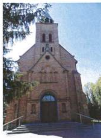
Zdjęcie 2. po lewej: Budynek gospodarczy, dawna mleczarnia z ok. 1937r., po prawej: Kościół parafialny pw. Przemienienia Pańskiego w Wieniu z 1958-1964 r. obiekty wpisane do Gminnej Ewidencji Zabytków Gminy Brześć Kujawski w 2023 r.

Należy podkreślić, że liczba obiektów w ewidencji zabytków nie jest stała, ponieważ mogą być do niej wpisywane kolejne zabytki lub wykreślane te, które zatraciły swój pierwotny charakter lub zniknęły z krajobrazu naszej gminy.