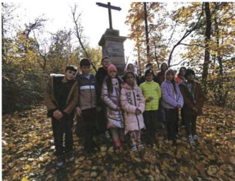
Zdjęcie 18. Uczniowie Szkoły Podstawowej w Brzeziu przy krzyżu pamiątkowym nad jeziorem z 4 ćw. XIX w. w miejscowości Brzezie wpisanym do Gminnej Ewidencji Zabytków (listopad 2023 r.)

Szkoła Podstawowa im. Kornela Makuszyńskiego w Wieńcu w latach 2022-2023 przeprowadziła następujące działania mające na celu popularyzację, promocję oraz edukację w zakresie wiedzy o dziedzictwie kulturowym gminy Brześć Kujawski: