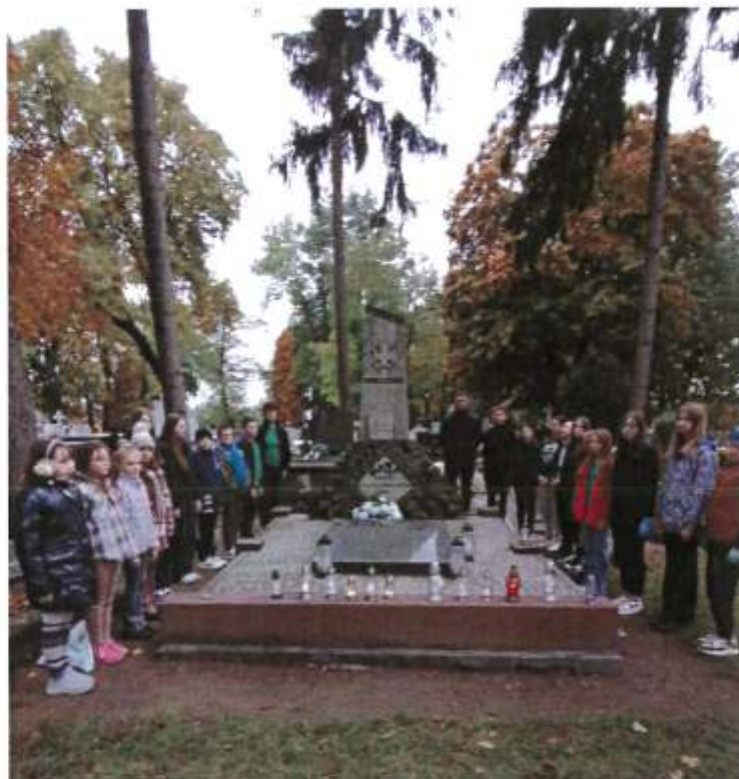
Zdjęcie 17. Uczniowie Zespołu Szkół nr 2 im. Marszałka Józefa Piłsudskiego w Brześciu Kujawskim przy Mogile zbiorowej żołnierzy Wojska Polskiego z 1939r. znajdującej się na terenie cmentarza parafialnego w Brześciu Kujawskim (październik 2023r.)

Szkoła Podstawowa im. Leopolda Juliana Kronenberga w Brzeziu w latach 2022-2023 przeprowadziła następujące działania mające na celu popularyzację, promocję oraz edukację w zakresie wiedzy o dziedzictwie kulturowym gminy Brześć Kujawski: