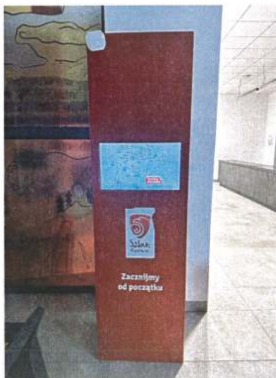
Zdjęcie 10. Interaktywny kiosk dotyczący Szlaku Piastowskiego w Informacji Turystycznej mieszczącej się w BCKiH „WAHADŁO” (2022r.)