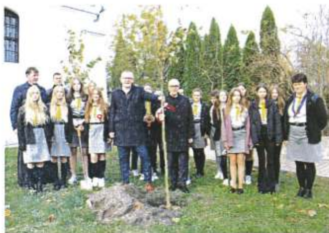
Zdjęcie 11. Sadzenie drzew – Brzostów (wiązów górskich) przy brzeskim klasztorze razem z 47. Drużyną Harcerską „Brzeskie Wilczki” listopad 2023 r.