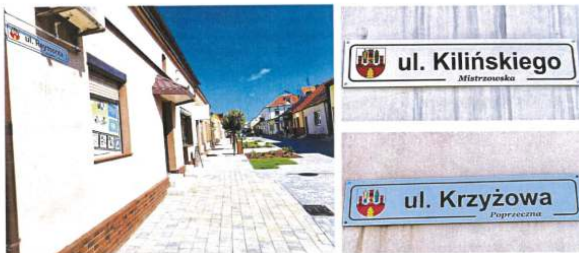
Zdjęcie 8. Tablice, na których obok współczesnych nazw ulic znajdują się także dawne nazwy (2023r.)

b) publikowanie folderów, ulotek oraz innych materiałów przybliżających mieszkańcom i turystom zasoby historyczne Gminy Brześć Kujawski (2022 r., 2023 r.):