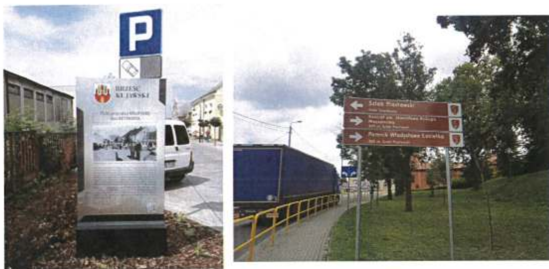
Zdjęcie 7. po lewej: Tablica z opisem merytorycznym historycznego miejsca ulicy Knapskiej - dziś ul. Reymonta (2023 r.), po prawej: Oznaczenia drogowe dotyczące Szlaku Piastowskiego (2022 r.)

- oznaczenia drogowe dotyczące SZLAKU PIASTOWSKIEGO (2022r.);