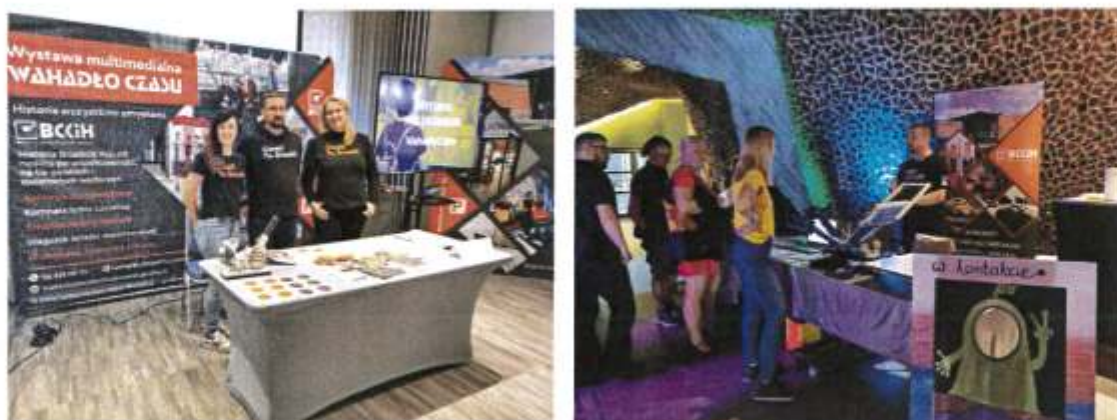
Zdjęcie 13. po lewej: pracownicy BCKiH „WAHADŁO” na giełdzie produktów turystycznych w Bydgoszczy (2023r), po prawej: pracownicy BCKiH „WAHADŁO” na Międzynarodowych Targach „w kontakcie” w Toruniu (2023r.)

b) nawiązywanie współpracy w zakresie dobrych praktyk w ramach partnerstwa krajowego i zagranicznego: