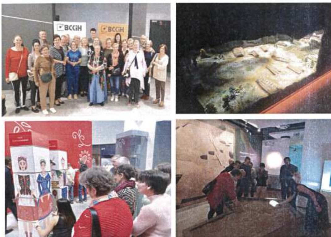
Zdjęcie 14. Uczestnicy projektów społecznych „Biblioteka w Wieńcu - miejsce wielu możliwości” oraz „Do integracji jeden krok - 1 edycja” podczas wizyty muzeum multimedialnym w BCKiH w 2022 r.

Przedszkole Publiczne nr 1 „Kraina Bajek” w Brześciu Kujawskim wraz z oddziałem przedszkolnym w Guźlinie w latach 2022-2023 przeprowadziły następujące działania mające na celu popularyzację, promocję oraz edukację w zakresie wiedzy o dziedzictwie kulturowym Gminy Brześć Kujawski: