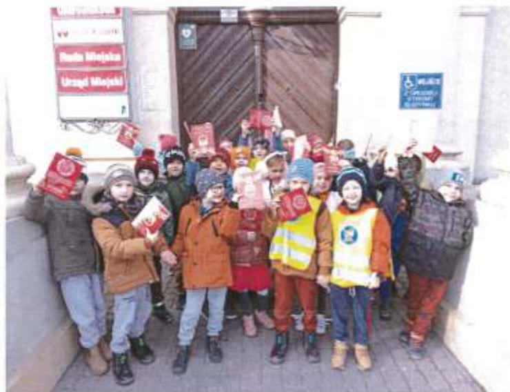
Zdjęcie 15. Przedszkolaki z Przedszkola Publicznego nr 1 „Kraina Bajek” w Brześciu Kujawskim podczas wizyty w zabytkowym budynku ratusza przy pl. Władysława Łokietka I w Brześciu Kujawskim (listopad 2022r.)

Szkoła Podstawowa nr 1 im. Władysława Łokietka w Brześciu Kujawskim w latach 2022-2023 przeprowadziła następujące działania mające na celu popularyzację, promocję oraz edukację w zakresie wiedzy o dziedzictwie kulturowym Gminy Brześć Kujawski: