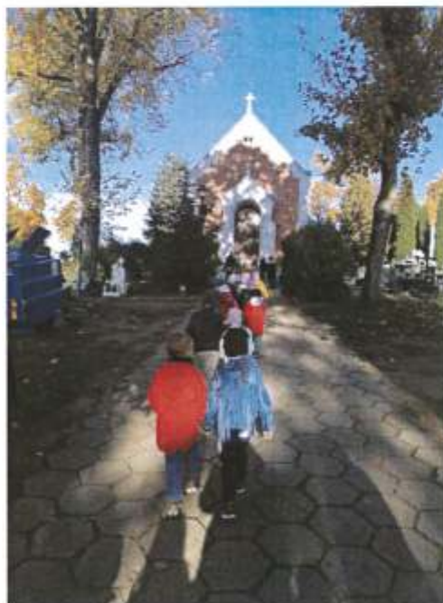
Zdjęcie 19. Uczniowie Szkoły Podstawowej w Wieńcu podczas wizyty na cmentarzu parafialnym w Wieńcu , przed kaplicą cmentarną z 1875r. wpisaną do Gminnej Ewidencji Zabytków (listopad 2023r.)

Oddziały przedszkolne w Szkole Podstawowej im. Kornela Makuszyńskiego w Wieńcu, odbywały spacer po miejscowości Wieniec, ze szczególnym zwróceniem uwagi na ważne zabytkowe obiekty znajdujące się w miejscowości.