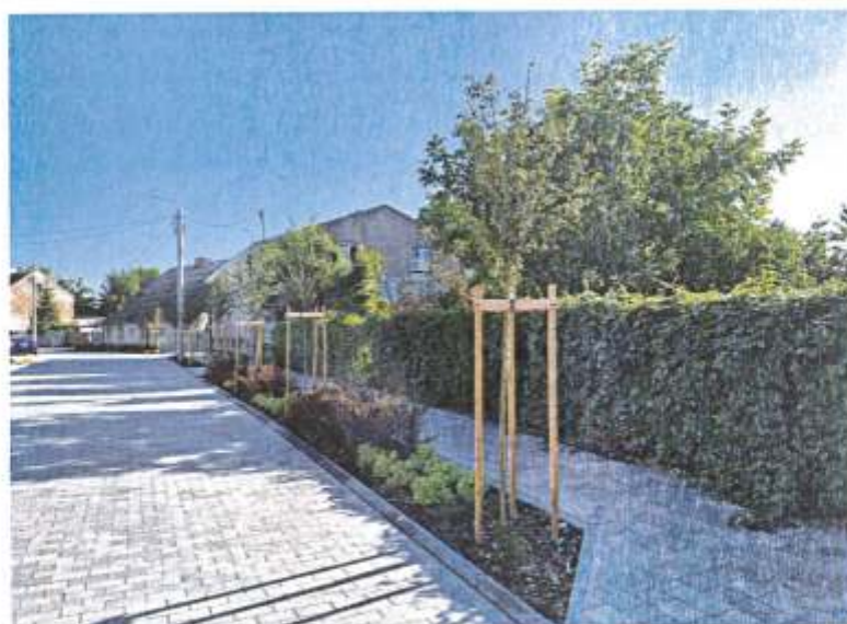
Zdjęcie 3. Przebudowana ul. Żeromskiego w Brześciu Kujawskim wraz z nowymi nasadzeniami (2023 r.)

a) Zagospodarowanie terenów zielonych w Brześciu Kujawskim, w ramach którego zostały wykonane nasadzenia w zabytkowym centrum Brześcia Kujawskiego oraz w pasie drogowym ul. Żeromskiego. Niniejsze zadanie zawierało się w obszarze Dzielnicy Starego Miasta wpisanej do Rejestru Zabytków oraz Gminnej Ewidencji Zabytków. Wartość zadania inwestycyjnego wyniosła 233 216,49 zł i została sfinansowana z budżetu gminy. Roboty zakończono 28.04.2023 r.