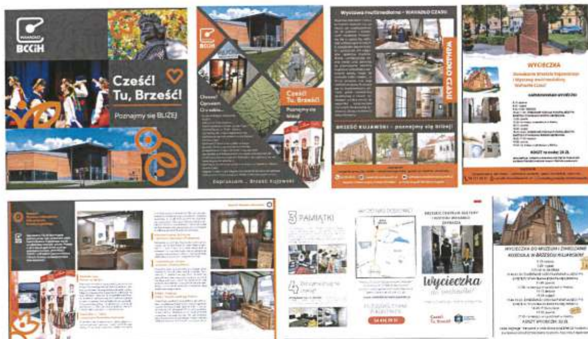
Zdjęcie 9. Folder i ulotki promujące zasoby historyczne gminy Brześć Kujawski (2022r.,2023r.)