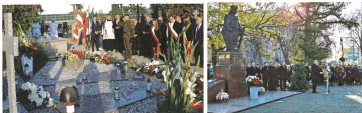
Zdjęcie 1. po lewej: Uroczyste obchody rocznicy wybuchu II wojny światowej 1 września 2023r. przy mogile zbiorowej żołnierzy Wojska Polskiego z 1939r. na cmentarzu parafialnym w Wieńcu, po prawej: uroczyste obchody Narodowego Święta Niepodległości 11 listopada 2023r. przy pomniku Władysława Łokietka

W ramach porozumienia w sprawie powierzenia zadań dotyczących utrzymania grobów i cmentarzy wojennych z Wojewodą Kujawsko-Pomorskim, Gmina Brześć Kujawski w okresie sprawozdawczym realizowała zadania wynikające z obowiązku utrzymania cmentarzy, kwater i grobów wojennych poprzez min.: dbanie o estetyczny wygląd obiektów grobownictwa wojennego i jego otoczenia, zapewnienie estetycznego wyglądu zespołu roślinności znajdującej się na cmentarzach, kwaterach i grobach wojennych poprzez nasadzenia roślinności dostosowanej do otoczenia czy wykonywanie bieżących zabiegów pielęgnacyjnych zieleni, przygotowywanie do uroczystego wyglądu obiektów grobownictwa wojennego w rocznice obchodów świąt państwowych i w Dniu Wszystkich Świętych. Na w/w zadania przeznaczono w 2022 r. - 2000 zł, w 2023 r. - 6000 zł w ramach dotacji od Wojewody Kujawsko-Pomorskiego. Ponadto, w 2022 r. została zaktualizowana gminna ewidencja obiektów grobownictwa wojennego.