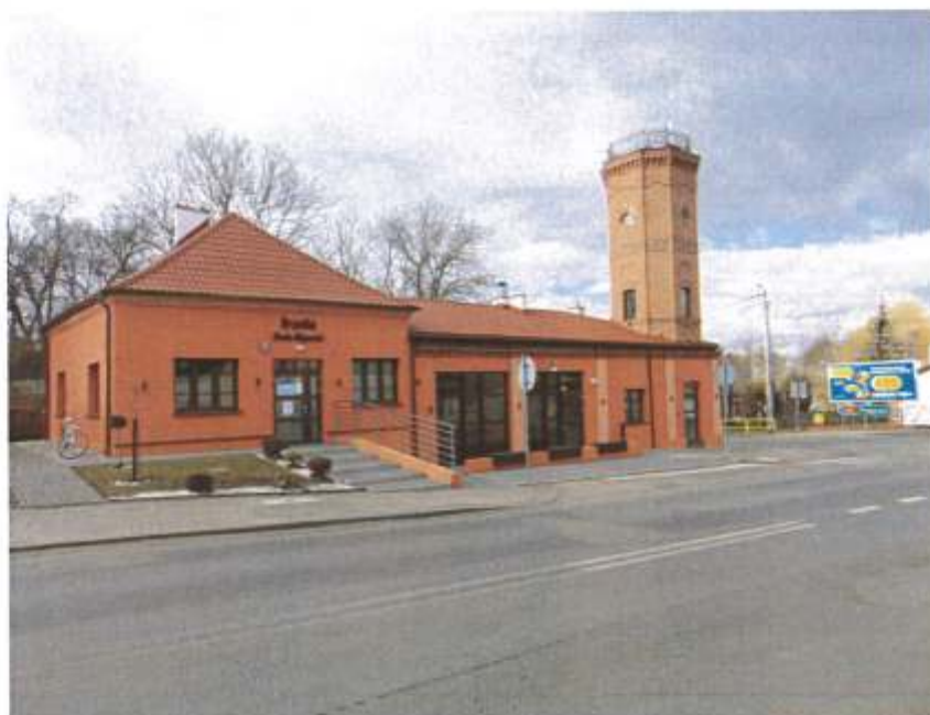
Zdjęcie 4. Budynek dawnej remizy straży pożarnej przy ul. Kolejowej 3 w Brześciu Kujawskim wpisany do Gminnej Ewidencji Zabytków po remoncie zakończonym w 2022r.

obszarów funkcjonalnych Regionalnego Programu Operacyjnego Województwa Kujawsko-Pomorskiego na lata 2014-2020, 120 428,67 zł zostało dofinansowane z Budżetu Państwa, a 145 103,75 zł sfinansowano z budżetu gminy. Inwestycję zakończono pozwoleniem na użytkowanie w dniu 19.01.2022 r.